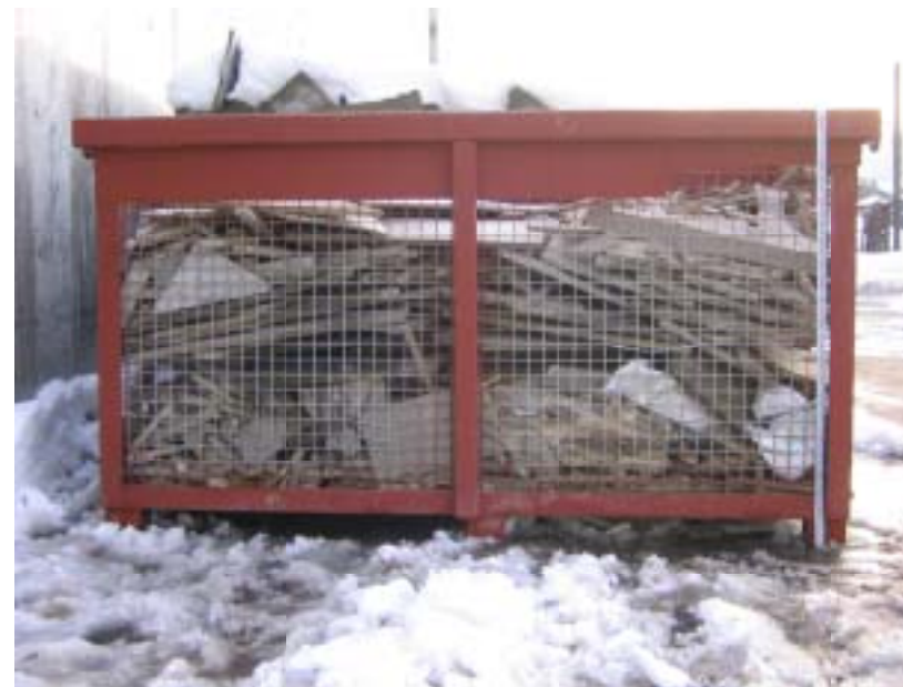
写真は下部構造がフォークリフト構造となっていないタイプです。